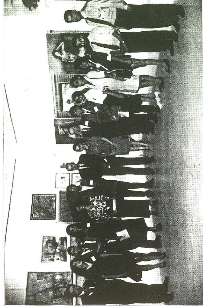
Le jour de l'inauguration